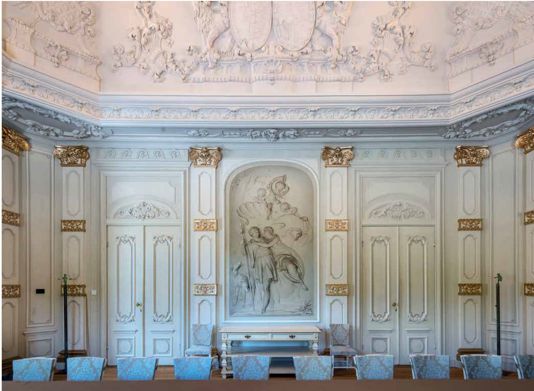
SCHILDERIJ ZAALSTUK AFSCHIED VAN ADONIS, WITTE EETZAAL PALEIS HUIS TEN BOSCH, JACOB DE WIT 1749 (FOTO RIJKSVASTGOEDBEDRIJF).