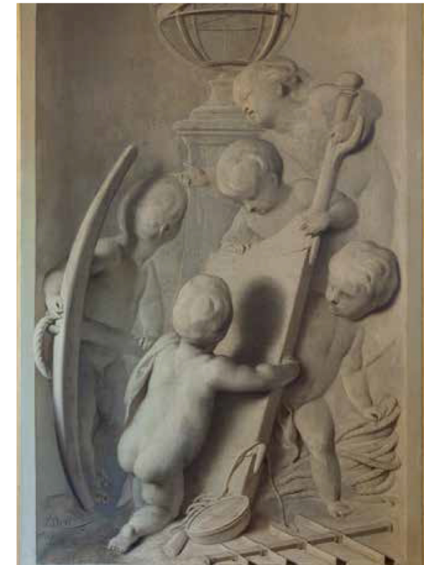
schilderij 'Mozes en de zeventig oudsten' (5 x 12 meter) en dertien Witjes in het stadhuis van Amsterdam wordt hij met 8.500 gulden vorstelijk betaald. Dat is in die tijd zesmaal het jaarinkomen van een gewone kunstschilder.

Door zijn talent maakt hij veel schilderijen. Naast productief is De Wit ook zeer zakelijk. Zo wordt hij de best betaalde schilder van zijn tijd. In 1741 koopt hij een dubbel huis aan de Keizersgracht 385 in Amsterdam en betaalt daarvoor 41.000 gulden in contanten.