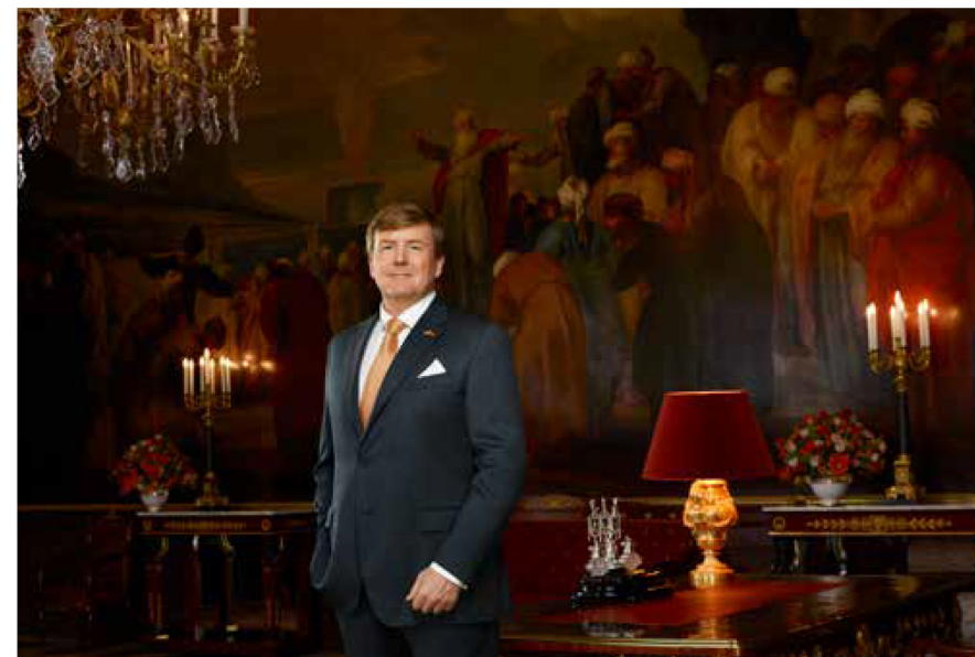
FOTO RECHTS: KONING WILLEM ALEXANDER IN DE MOZESZAAL, 2018.

Ook doordat Jacob de Wit (1695-1754) vermogende opdrachtgevers aanzienlijke prijzen in rekening bracht voor zijn bijzondere schilderijen, kreeg zijn werk status.