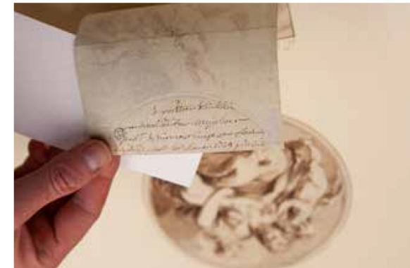
FOTO BOVEN: HERPLAATST PLAFOND AURORA, JACOB DE WIT 1744, SINDS 1970 IN MUSEUM WILLET-HOLTHUYSEN AMSTERDAM.