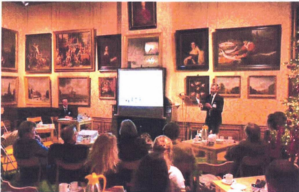
Kick-off bijeenkomst in het Cromhouthuis d.d. 19/12/2016