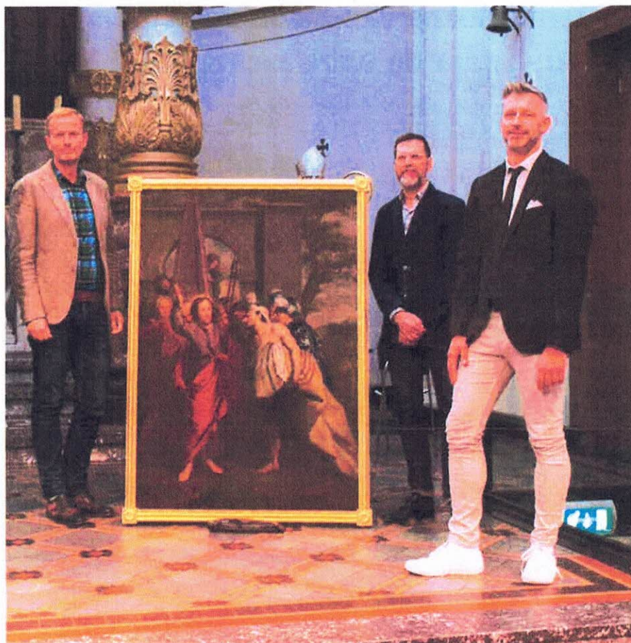
Paroollezing 'Op zoek naar de ware Jacob' d.d. 31/08/2017 in het kader van Open Monumentendag