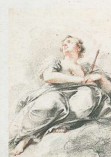
Tekening van Juno. Voorstudie plafondschildering Jacob de Wit voor Huis Cromhout.

eniging Rembrandt bereid was miljoenen uit te geven aan de Vlaamse Rubens, niet bood op het werk van onze Nederlandse Jacob de Wit. De tekening van Juno uit 1718 was waarschijnlijk een studie voor de plafond-schildering in het Amster-