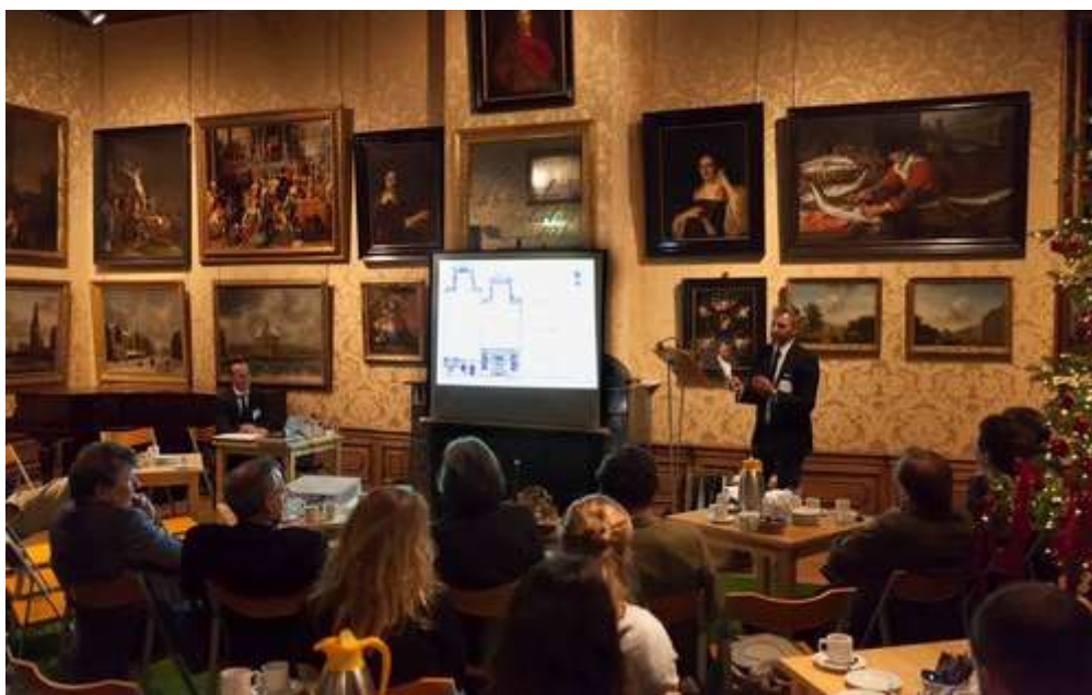
Kick-off bijeenkomst in het Cromhouthuis d.d. 19/12/2016