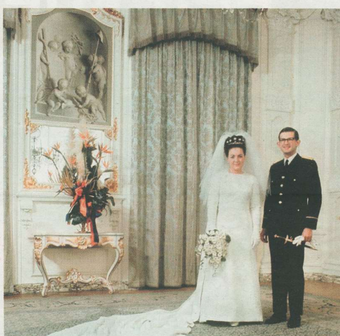
Prinses Margriet en Pieter van Vollenhoven op hun huwelijksdag in 1967. Zij staan bij de 'Allegorie van de Vrijheid' van Jacob de Wit in de witte eetzaal van Huis ten Bosch. Dit 'Witje' hangt nog steeds in het paleis waar onlangs het koninklijk gezin is komen wonen.