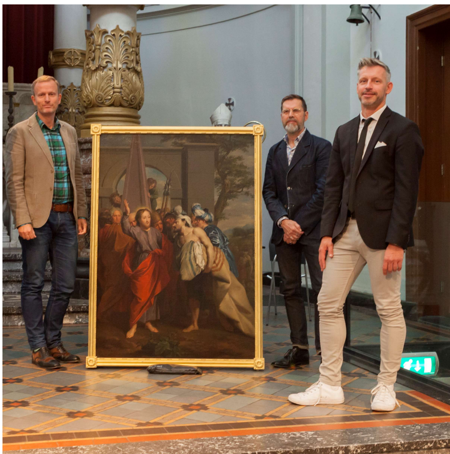
Parollezing 'Op zoek naar de ware Jacob' d.d. 31/08/2017 in het kader van Open Monumentendag